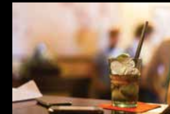
O Koktejl delavnica