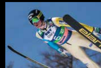
G Planica 2013