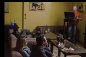
P Potopisni večer: Po severnih obzorjih