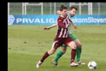
A NK Triglav: NK Olimpija