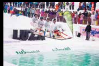
P Luža 008