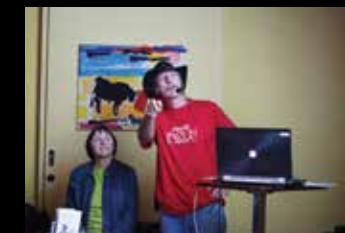
B Potopisni večer: Avstralija in Nova Zelandija