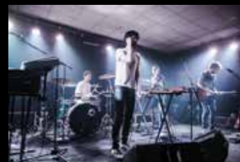
M Moveknowledge v Trainstation Squatu