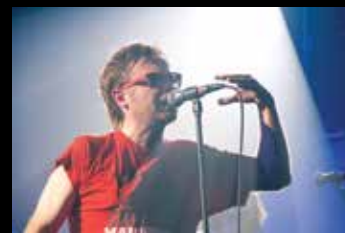
B KŠK žur z Big Foot Mamo