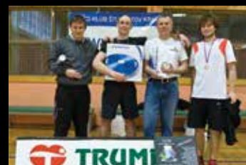
G KŠK-jev turnir v badmintonu