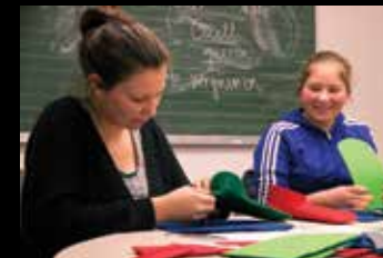
B Ustvarjalna delavnica: Filcani copati