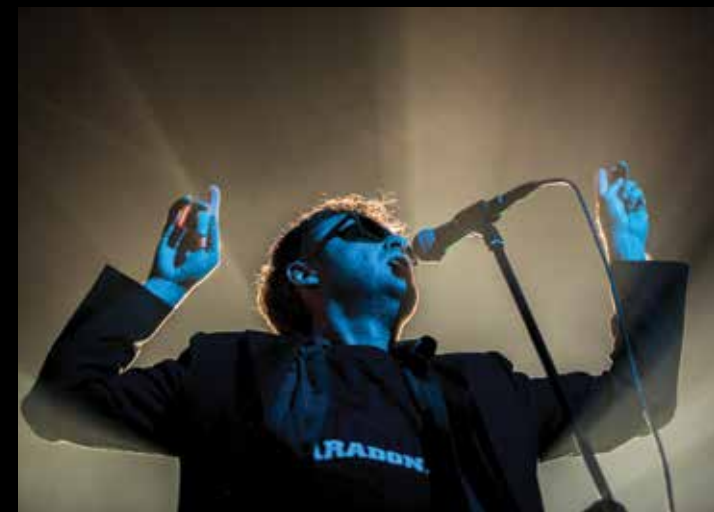
M KŠK žur z Big Foot Mamo